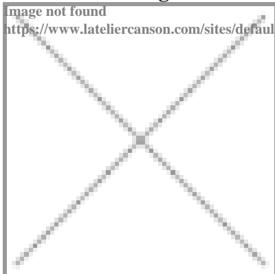
image not found https://www.lateliercanson.com/sites/default/files/styles/miniature___lire_aussi/public/Pochette%20C%20a%20grain%20dessin%20blanc.jpg?itok=ljrZj902