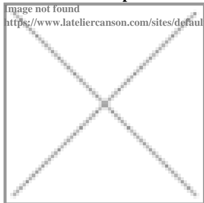
image not found https://www.lateliercanson.com/sites/default/files/styles/miniature___lire_aussi/public/Miniature-HistArt-Ins-M.C-Escher.jpg?itok=vy227aIz

Découvrez avec les enfants l'oeuvre de M.C. Escher, inspirée de concepts mathématiques et réalisez des pavages aussi ludiques que surprenants.