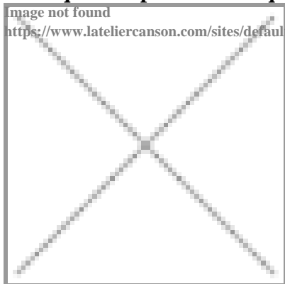
image not found https://www.lateliercanson.com/sites/default/files/styles/miniature___lire_aussi/public/Miniature-DessinAct-Panier-de-Paques-Bunny-.jpg?itok=AyOw0_C8