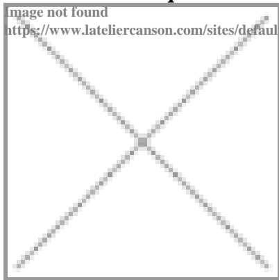
image not found https://www.lateliercanson.com/sites/default/files/styles/miniature___lire_aussi/public/Miniature-DessinAct-sitting-bull-et-jolly-jumper.jpg?itok=Z3ZD_CyT

Réaliser les masques de Sitting Bull, acteur incontournable de l'histoire des Indiens mais également de Jolly Jumper,